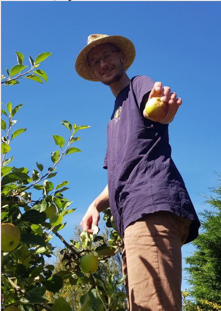
Hilfe im Garten

Ältere Ehepaare nehmen junge Menschen auf, weil sie viel Platz im Haus haben und Unterstützung im Alltag brauchen. Alleinstehende befassen sich erstmals ernsthaft mit dem Gedanken, „jemand Fremdes“ ins